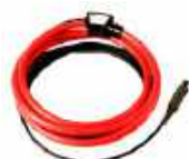
Pinza flexible FSX-3 (fi 630 mm), nivel de salida 300 mV / 1 A WACEGFSX30KR