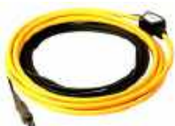
Pinza flexible FS-2 (fi 1260 mm), nivel de salida 100 mV / 1 A WACEGFS20KR