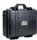
Funda rígida XL8 WAWALXL8