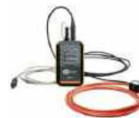
Adaptador ERP-1 con pinza flexible FSX-3 y estuche WAADAERP1V3