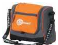
Funda M6 WAFUTM6