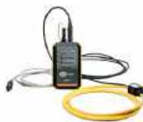
Adaptador ERP-1 con pinza flexible FS-2 y estuche WAADAERP1V2