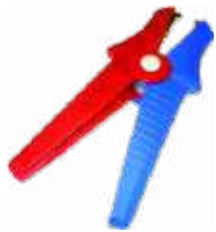
2 x cocodrilo Kelvin 1 kV 25 A WAKROKEL06