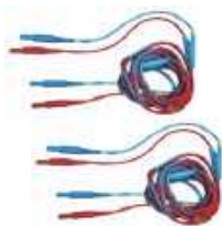
Cable de dos hilos (10 / 25 A) 3 m U1 / I1 WAPRZ003DZBBU111 U2 / I2 WAPRZ003DZBBU212