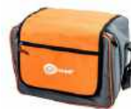
Funda L11 WAFUTL11