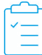
Certificado de calibración de fábrica