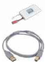
Batería recargable de ion-litio 7,2 V WAAKU27 Cable de transmisión, terminado con conector USB WAPRZUSB