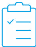
Certificado de calibración con acreditación