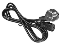
Cable de alimentación 230 V IEC C13 WAPRZ1X8BLIEC