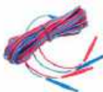
Cable de dos hilos (10 / 25 A) U1 / I1 6 m / 10 m / 15 m WAPRZ006DZBBU111 WAPRZ010DZBBU111 WAPRZ015DZBBU111